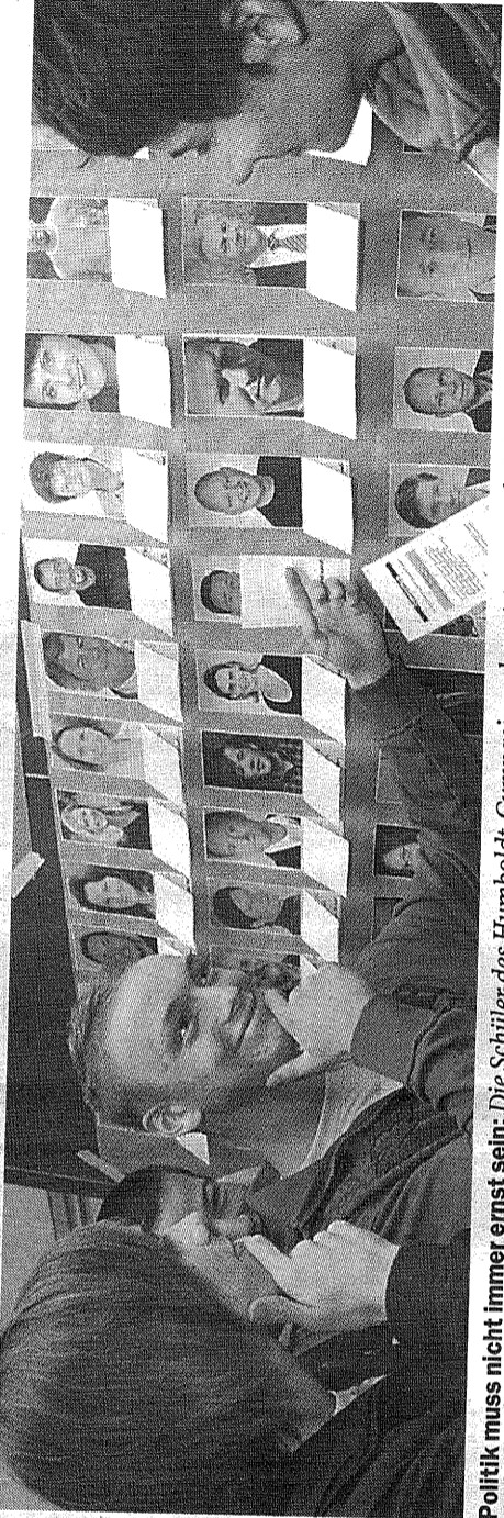
Politik muss nicht immer ernst sein: Die Schüler des Humboldt-Gymnasiums konnten gestern bei der U18-Wahl abstimmen.

hängen die Programme der Parteien nebeneinander, gegliedert nach Themengebieten wie „Jugendkultur“ oder „Einstellung zum Neubau des Landtags“. Doch die Jugendlichen sollen sich auch beteiligen können: An einer Pinwand hängen Fra-