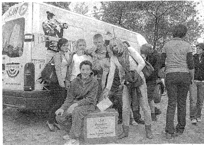
Symbolische Stimmabgabe fürs Foto: Jugendliche der Lenné-Schule nach der erfolgreichen Auszählung mit der Wahlurne.